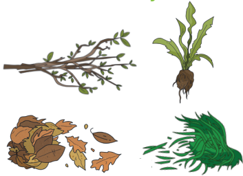
Vipandikizi vya bustani